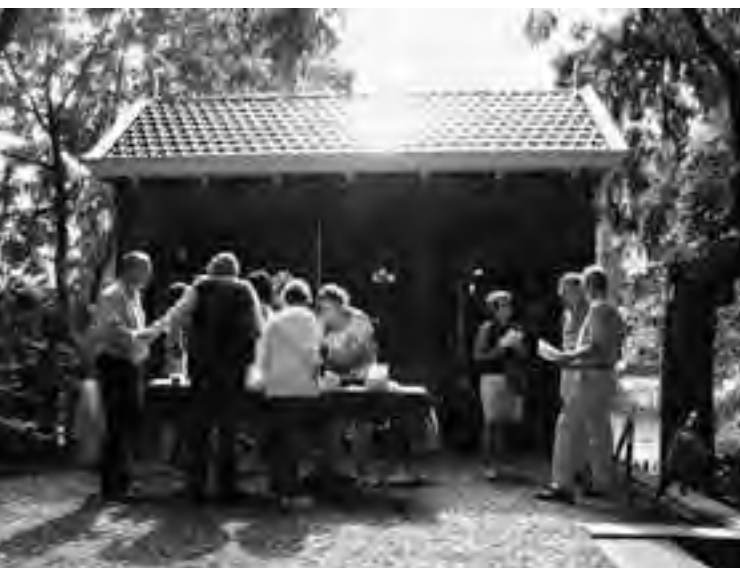
De presentatie van de VSW-op-locatie.

zerken de teksten te lezen. Een bezoeker: "De vader van mijn vader ligt hier begraven. Maar z'n grafsteen ligt zo plat, dat vind ik niet mooi. Ik ga proberen of die steen niet rechtop gezet kan worden of verhoogd. Ook een oom, de broer van mijn vader, ligt hier. Kijk, er staat een prachtig gedicht op z'n grafsteen. Toen ik las dat het kerkhofje vandaag geopend zou zijn, heb ik me direct voorgenomen om erheen te gaan. Vroeger kwam ik hier regelmatig de graven verzorgen. Toen kon je de sleutel nog halen bij het politiebureau aan de Ringdijk. Maar sinds dat een muziekschool is geworden, kan je als nabestaande het kerkhof niet meer op.