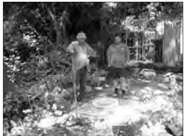
Slopers van Huize Bergsteyn hebben een handje geholpen.