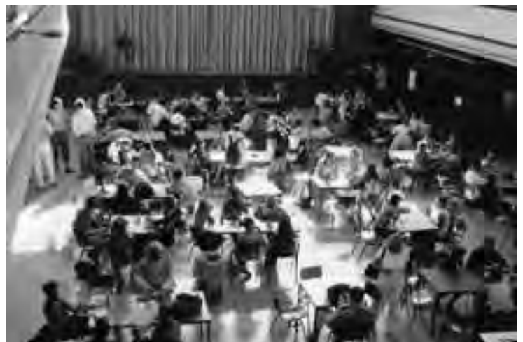
In het hoofdgebouw de centrale overblijfruimte die tevens voor aula dient (foto september'05).

De voorbereiding van de bouw kostte veel tijd, ons land was door de 2e Wereldoorlog verarmd en de budgetten voor gesubsidieerde bouwwerken waren extreem laag. Plannen en materiaalkeuze werden streng gecontroleerd door het Rijk, alles moest doelmatig zijn maar vooral sober en goedkoop. Isolerende beglazing en voorzieningen voor gehandicapte leerlingen waren financieel uitgesloten. Daarna verliep de bouwuitvoering voorspoedig. Voor