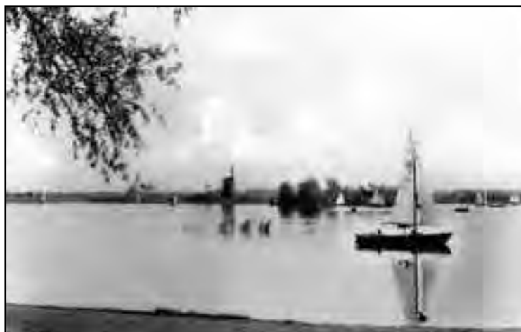
De Bergse Plas in de vijftiger jaren.