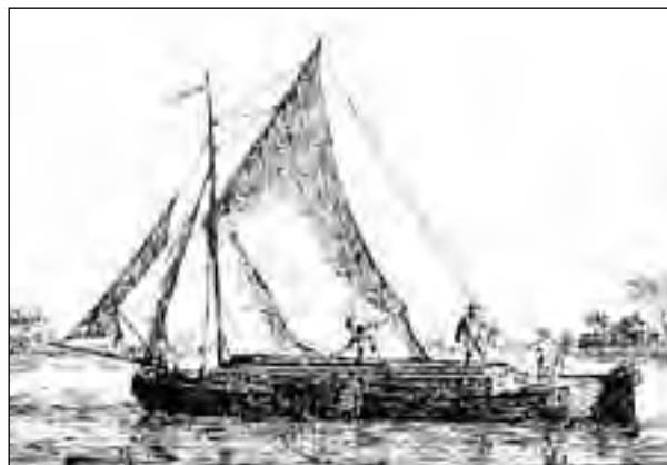
Turfschip met een emmerzeil.

Maar na het einde van het conflict kwam de steenkolenhandel weer snel op gang en raakten veel veenarbeiders hun werk kwijt. Het definitieve einde van een tijdperk met turf als belangrijke energiedrager. In de minder welvarende landen in Oost Europa wordt ook nu nog goedkope lokaal gewonnen turf (en bruinkool) gestookt. Bij ons komt men gestoken turven nog wel eens tegen in tuinentra, niet als brandstof, maar als decoratiemateriaal voor het afdekken van vijverranden.