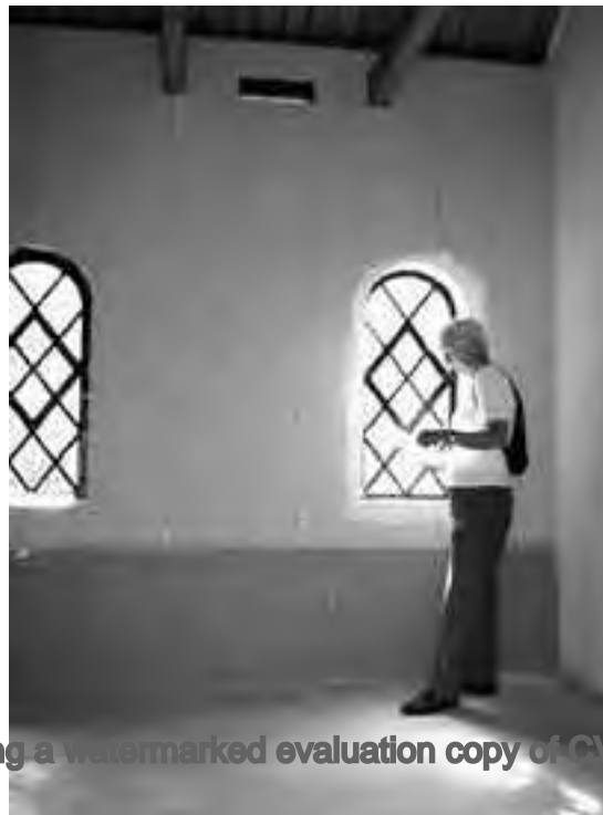
Het baarhuisje werd van binnen en buiten bekeken.