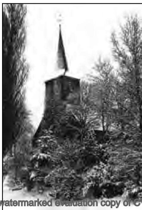
De Hillegondakerk in de sneeuw.

Op de laatste pagina van Tussen Wilgenplas & Rotte weer een paar oude ansicht- kaarten.