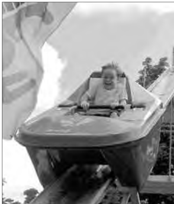
De nieuwe attractie Kangaroetsjijj! (naam bedacht door een 11-jarige jongen naar aanleiding van een prijsvraag).

tijden veranderen. In de jaren vijftig en zestig wordt de auto gemeengoed en trekken de Rotterdammers massaal de stad uit. Ook de opkomst van de zeer grote pretparken leidt tot minder bezoekers in Plaswijck en dus tot minder inkomsten, waardoor er praktisch geen geld meer is voor vernieuwing en onderhoud. Zo raakt het park, voor de oorlog door de Rotterdammers “het Paradijs” genoemd, langzaam in verval.