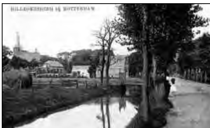
De Straatweg – toen nog Bergweg geheten – in 1917.