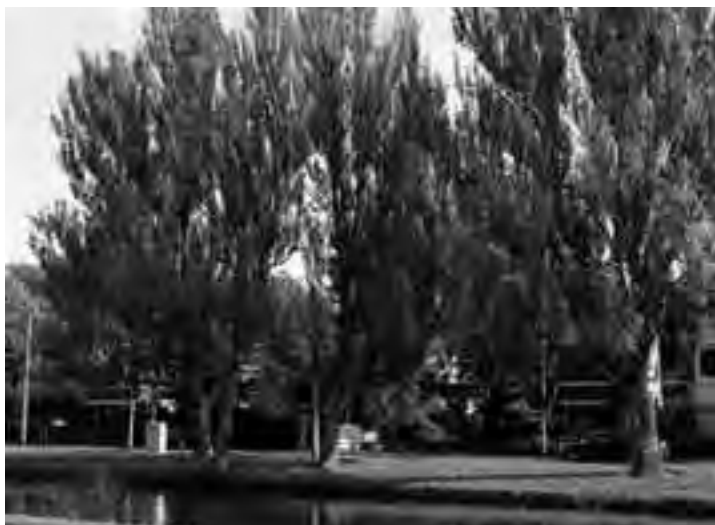
Vier schitterende witte abelen aan de Van Kempensingel.