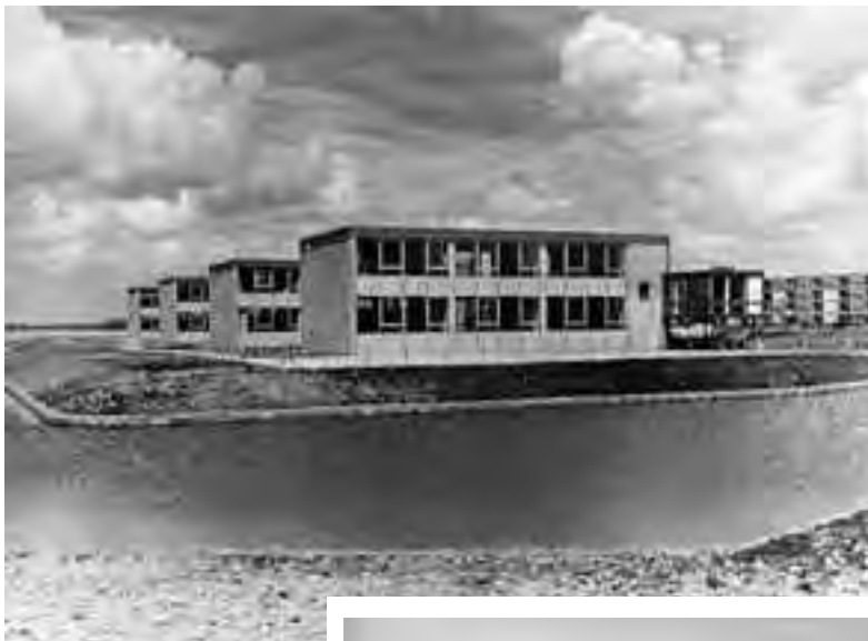
De vier paviljoens in 1960. Van de Jasonweg ontbreekt nog elk spoor.

Het Caland Lyceum in 1962 gezien vanuit zuidoostelijke richting. Rechts op de foto de conciergewoning.