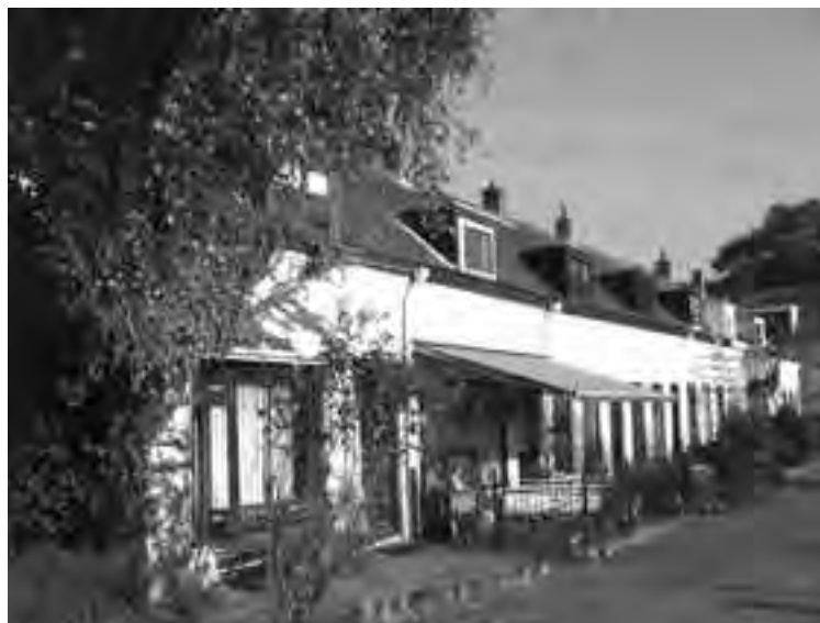
De acht daglonershuisjes aan de Molenwerf.