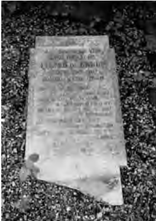
Een gedicht siert het graf van Pieter de Lange.

Misschien wil de VSW in de toekomst het begraafplaatsje wel op bepaalde uren openstellen, zou mooi zijn".