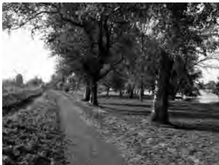
De populieren langs het Prinsenmolenpad.

andere negen witte populieren. De witte populier ( populus alba of witte abeel) komt voor in het Middellandse zeegebied en in centraal Europa en Azië. De grauwe abeel ( populus canescens ) is een bastaard van de witte abeel en de ratelpopulier ( populus tremula ofwel esp). De esp komt van