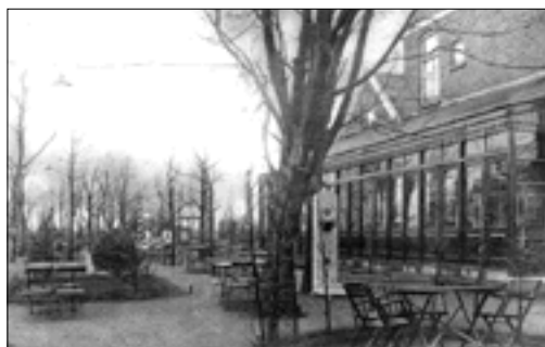
Voormalig restaurant De Plas.

"Het gebouw op de foto is volgens mij het voormalig restaurant De Plas aan de Straatweg 107 te Hillegersberg, daarvoor werd deze uitspanning Zomerlust genoemd", schreef Bert Schipper. Zover wij weten stamt het oorspronkelijke herenhuis (twee lagen met kap) uit 1879 maar het kan ook 1896 zijn. Rond 1900 zat de uitspanning Tivoli er in, later – vanaf 1910 – heette het restaurant Zonnelust. Daarna was tot 1983 restaurant De Plas erin gevestigd. Sinds 1983 zit in het pand een Chinees restaurant.