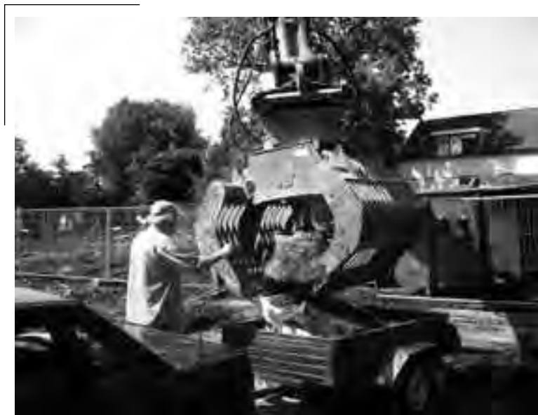
De put wordt op het karretje getakeld.