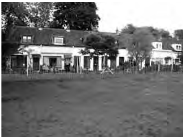
Om de Molenwei is al een hek gezet.

Elk huisje heeft een voordeur en twee ramen. Soms zijn huisjes samengevoegd, of er werd één groot raam in gemaakt in plaats van twee ramen. Mogelijk wordt dat weer eens in de originele staat teruggebracht. Het aardige aan de huisjes is dat er zeer bescheiden dakkapelletjes op zitten, alle min of meer gelijkvormig. Meestal worden zulke huisjes verpest door grote ramen en veel te grote dakkapellen. De Molenwerf dankt zijn naam aan de molen die hier tot ca 1930 stond, de korenmolen 'de Zonnebloem', hij staat nog op de