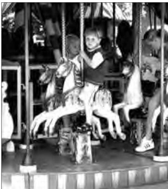
Een ouderwetse draaimolen in een modern attractiepark.

Een stukje geschiedenis: in 1914 koopt de heer C.N.A. Loos de villa Plaswijck, gelegen aan de Straatweg. Hij begint een theeschenkerij die veel publiek trekt. De belangstelling wordt nog groter als hij in 1921 de aangrenzende weilanden koopt en daar een prachtig park van maakt. Na de Tweede Wereldoorlog worden er in Plaswijck nieuwe projecten op stapel gezet. Maar de