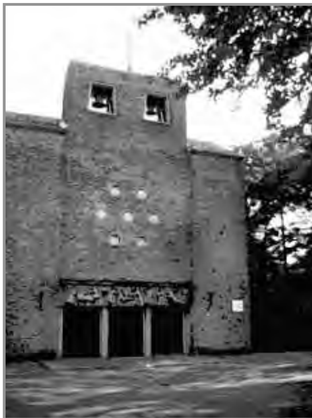
De Liduinakerk is ooit met een garage vergeleken.

Op de novemberbijeenkomst is het boekje natuurlijk te koop en daarna bij de VSW en bij de vertrouwde boekhandels op de Bergse Dorpsstraat, de Peppelweg en de Kleiweg.