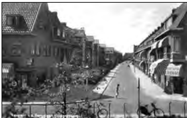
Hillegersberg Kerstant v.d. Bergelaan, ca 1935