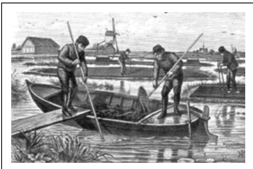
Het afgraven van het veen onder de waterspiegel – aanvankelijk modder - gebeurde in bootjes en was lichamelijk zeer zwaar werk. De modder werd op het land te drogen gelegd en daarna in turven uitgestoken, zoals ook op dit plaatje te zien is.

Het boekje telt 32 bladzijden. Het bevat een paar mooie kaarten waarvan enkele in kleur. De oplage omvat voorlopig 100 stuks, de prijs zal rond de 5 tot 7 Euro komen te liggen. Landschap in Baksteen is te koop op de komende meivergadering en tijdens andere gelegenheden waarbij de VSW zich presenteert.