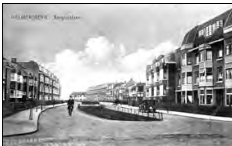
Het eerste deel van de Berglustlaan, begin 20'er jaren.

Pure nostalgie, die oude ansichtkaarten, maar wat een geluk dat iemand er – lang geleden – brood in zag om ze te maken. Want nu kunnen we er – al dan niet met gemengde gevoelens – ons hart aan ophalen. De oude plaatjes vullen niet alleen onze herinneringen aan, maar kunnen voor degenen die de straten niet van vroeger kennen, een extra dimensie betekenen.