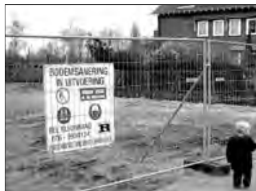
Opeens is weer een flink stuk van de Bergse Achterplas vanaf de Straatweg te zien