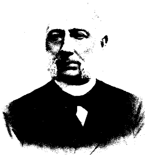
ADRIAAN DE MONCHY. 31 MAART 1822-17 APRIL 1912 •

Schrijnende voorbeelden van lichamelijke gebrekkigheid, aangeboren of als gevolg van ziekte, worden aangehaald en resultaten na behandeling. Wellicht in het licht van de huidige tijd, met al zijn verworvenheden, niet zo aansprekend meer, doch gezien in het licht van de maatschappelijke omstandigheden in het begin van deze eeuw een "lichtend" voorbeeld en zelfs meer dan dat, een uiting van een grote geest.