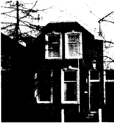
2 Straatweg 252** Huize 'Sorghvliet'.