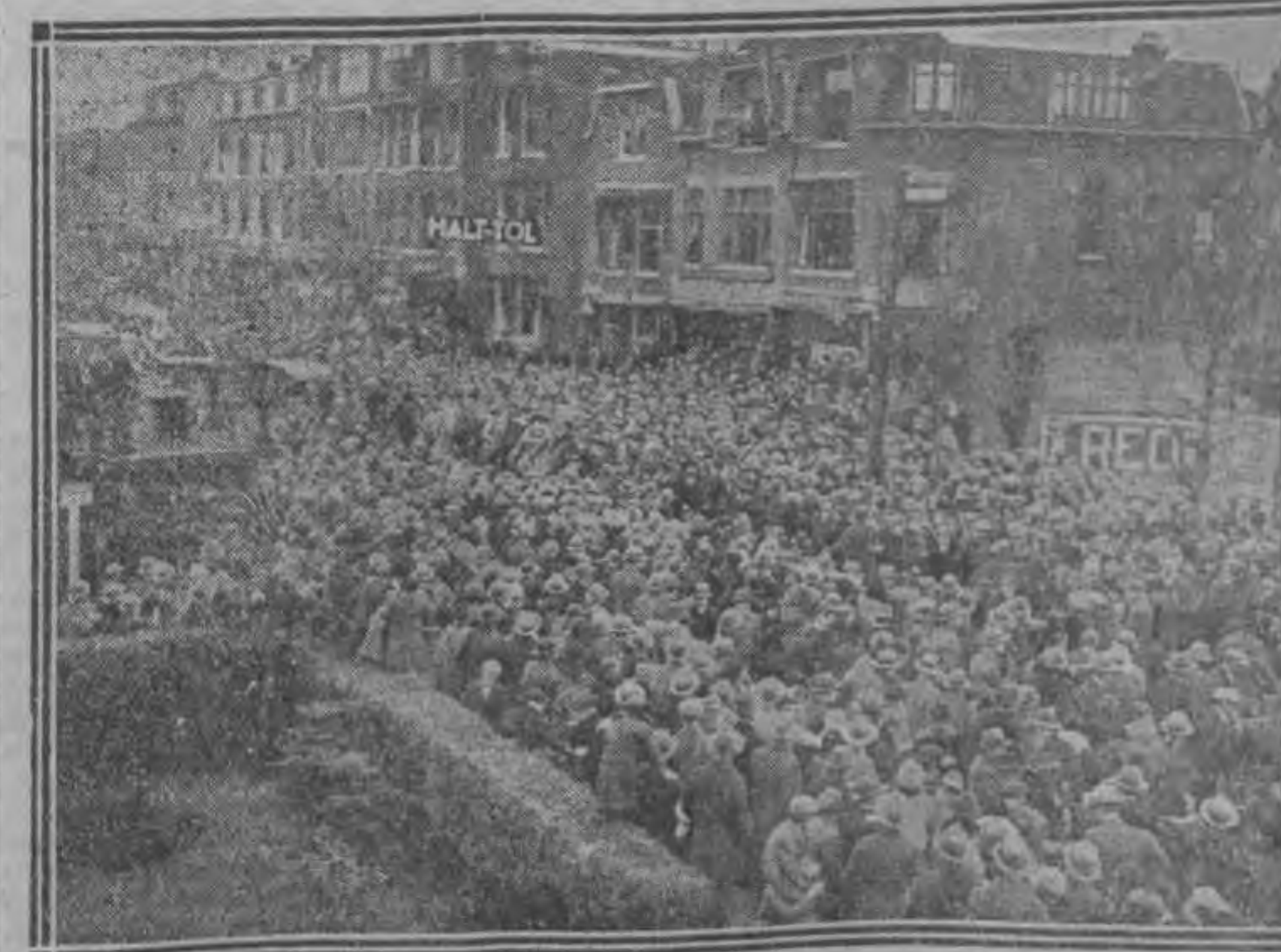
De officiële opheffing van den Hillegersbergse tol is niet, wat men onopgemerkt voorbijgegaan. Deze foto toont, hoe druk het gistermiddag tusschen 12 en 2 op den Straatweg was; het plaveisel was

niet meer te zien. Het „Halt-toi“ hing toen nog dreigend boven de straat. Spoedig zou ook dit lichtbakje verdwijnen. Daarna, stond niets het verkeer meer in den weg!