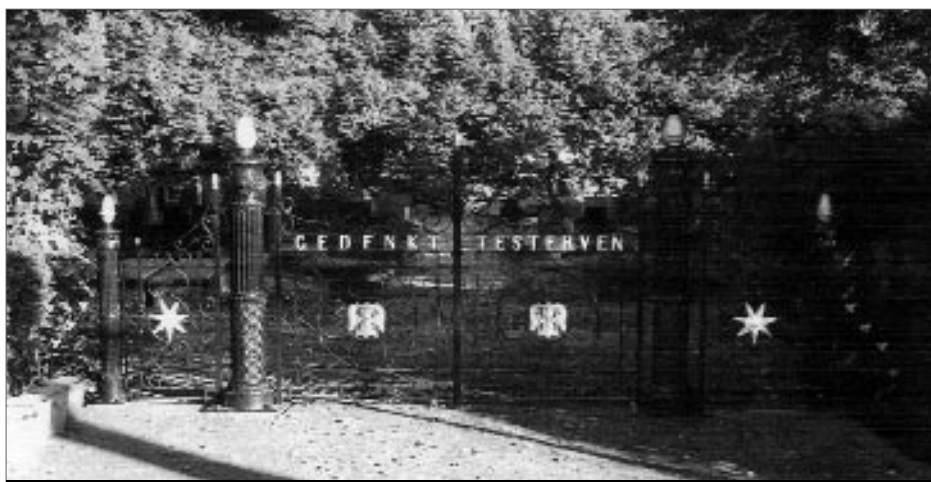
Het hek van de begraafplaats te Eenrum.

De Koninklijke Vereniging voor Facultatieve Crematie publiceerde op de voorpagina van haar maartnummer Verenigings Nieuws een foto van het vorig jaar gerestaureerde en in de originele toestand teruggebrachte toegangshek van de protestantse begraafplaats te Eenrum. Dit hek, vervaardigd door Pletterij Den Haag en waarschijnlijk gegoten bij