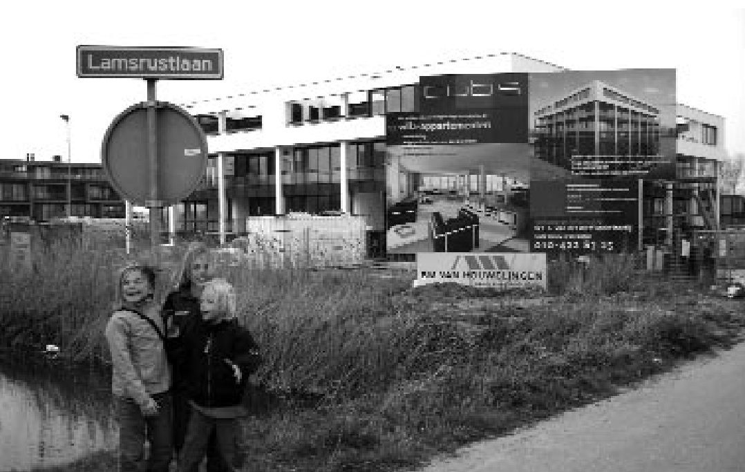
Waar zijn de lammetjes gebleven?

Met deze fantasie is de naam Lamsrust echter niet verklaard. Wellicht liepen in de buurt en op de grond rond het huis lammeren rustig te grazen.