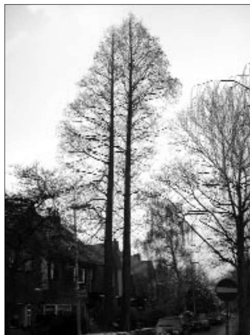
Nog een 'tweeling' in de tuin van de Villeneuvesingel nr. 3.

Vanwege de oorlog tussen China en Japan (1937-1945) kon geen nadere analyse plaatsvinden. Pas veel later, nadat expeditie naar het gebied werden georganiseerd, konden zaden naar verschillende laboratoria en arboreta worden gestuurd. In 1948 kwamen de eerste zaden aan in het Arnold Arboretum te Boston. Vandaaruit vond verspreiding plaats naar diverse arboreta over de hele wereld. Ook Nederland kreeg dat jaar zaad aangeboden. Het is goed te realiseren dat geen enkel exemplaar van deze boom in Europa en Amerika ouder is dan het jaar 1948. De boom is inmiddels over de hele wereld verspreid en is ook in Nederland thans algemeen. De zaadproductie (kegels) komt in ons land pas na het 30e jaar op gang. De boomkwekerijen blijven aangewezen op vegetatieve vermeerderingsmethoden.