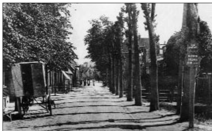
Begin Dorpsstraat richting Grindweg. De snelheidsbeperking van 15 kilometer per uur was ietwat overbodig. Auto's kende Hillegersberg in 1910 nauwelijks en de paard en wagens, die het hele verkeersbeeld uitmaakten konden niet harder.