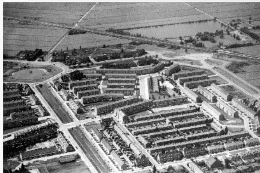
Peppelweg en Kastanjesingel (1955).