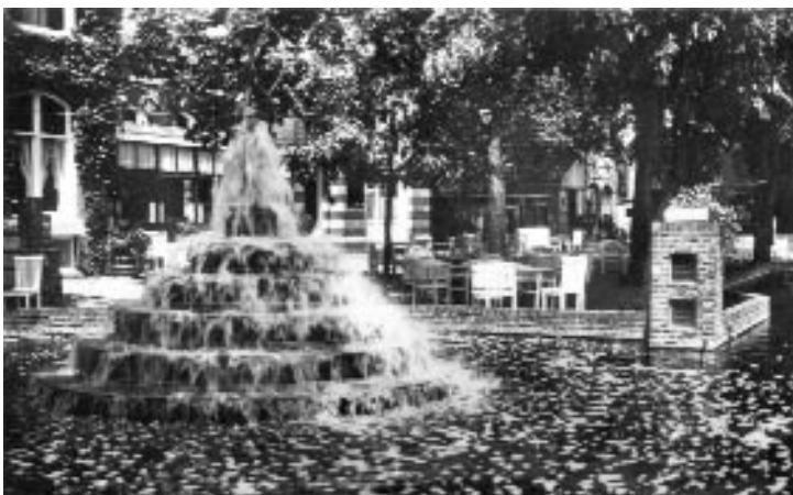
De fontein voor Lommerrijk.