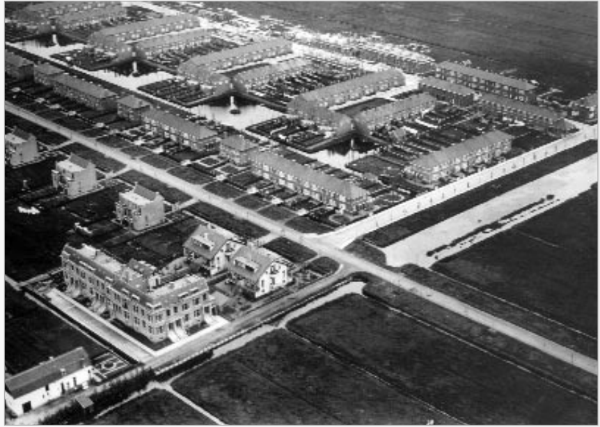
De Molenlaan en de Terbregse laan in 1923.