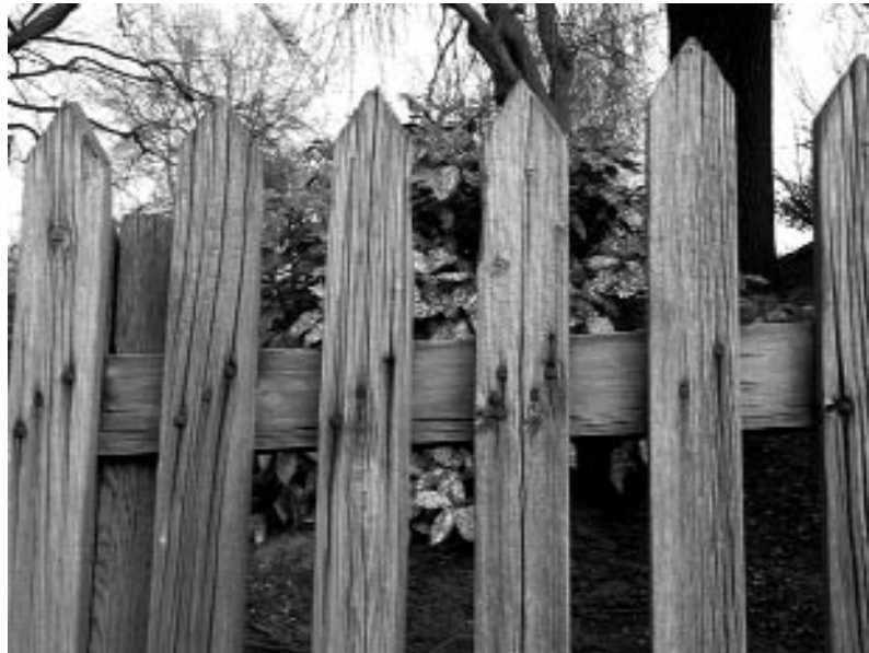
Het hek is destijds met handgesmede spijkers in elkaar gezet.

Ik heb de heren van de gemeentebegraafplaatsen ervan kunnen overtuigen dat het hek met wat kleine inspanningen nog wel tien jaar mee kan. Dat het begraafplaatsje op de nominatie staat om gemeentelijk monument te worden. Dit lattenhek met 'punten' zou uiteindelijk wel vervangen moeten worden, maar dan weer door zo'n zelfde hek. Dat gaat dan misschien wel iets meer kosten dan een efficiënt 'Heras' hek. De VSW wil te zijner tijd graag eraan mee werken om te kijken of we hiervoor nog wat extra fondsen kunnen vinden.