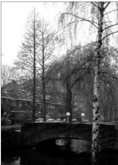
Twee Chinese Moerascipressen bij de ingang van Huize Liduina.

Over de benaming is veel te doen geweest. De boom heeft geen enkele relatie tot een spar of een lariks; taxonomen hebben hem uiteindelijk ingedeeld bij de moerascipressen, omdat hij verwantschap laat zien met de Amerikaanse moerascipres ( taxodium distichum ). De officiële naam is nu: Metasequoia Glyptostroboides .