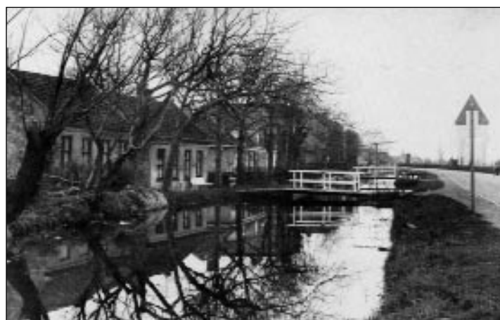
Het begin van de Grindweg omstreeks 1925