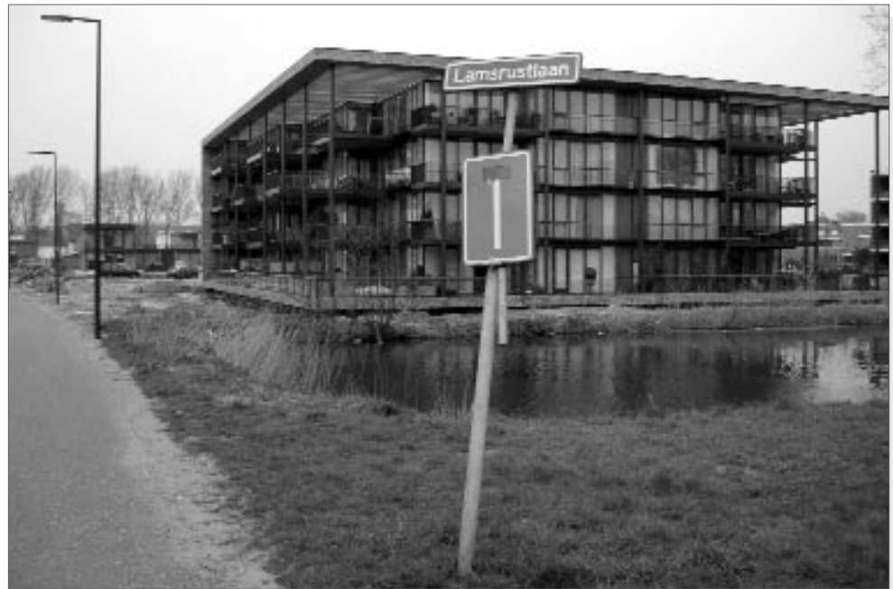
Hier wordt al in de Lamsrustlaan gewoond.