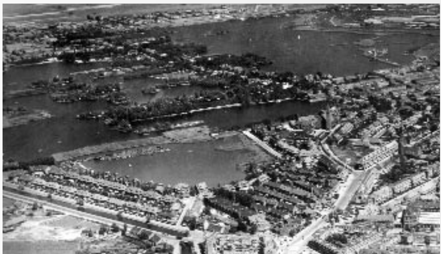
Kleiwegkwartier en Plassengebied in 1938.