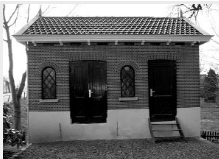
De buitenkant van het baarhuisje, inclusief het voegwerk, is klaar.

Nu hopen we binnenkort de binnenkant uit te laten voeren zodat we het halverwege het jaar 2007 in gebruik kunnen gaan nemen. Er zijn drie aannemers die een prijs hebben neergelegd. We hebben een groot deel van de financiën voor de binnenafbouw te danken aan Stichting Berg en Broek. Dus met een beetje geluk kunnen we ons jubileum in augustus daar vieren.